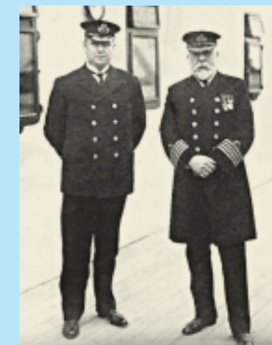
Kapitän Edward Smith, Zahlmeister Hugh Walter Mc Elroy (Beide überlebten die Jungferreise nicht.)